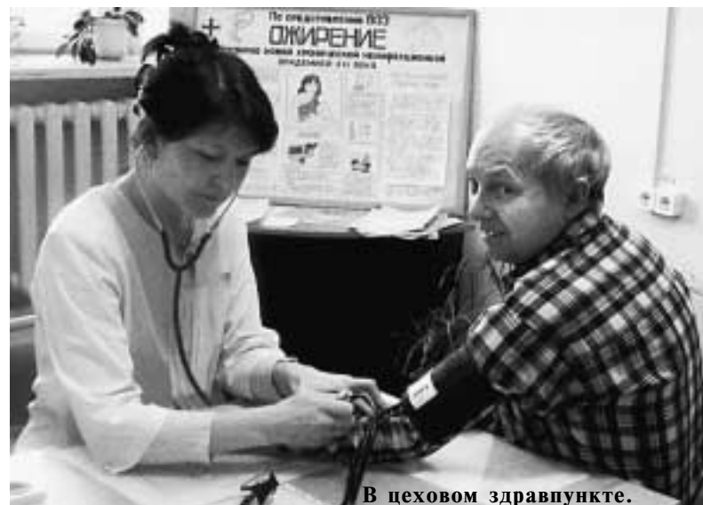
В цеховом здравпункте.

Никакой кризис не смог затравить комбинат свернуть свои социальные проекты. В рамках нацпроекта «Здоровье» продолжалась реализация программ стимулирования рождаемости, поддержки многодетных семей. Свыше 160 будущих мам за год