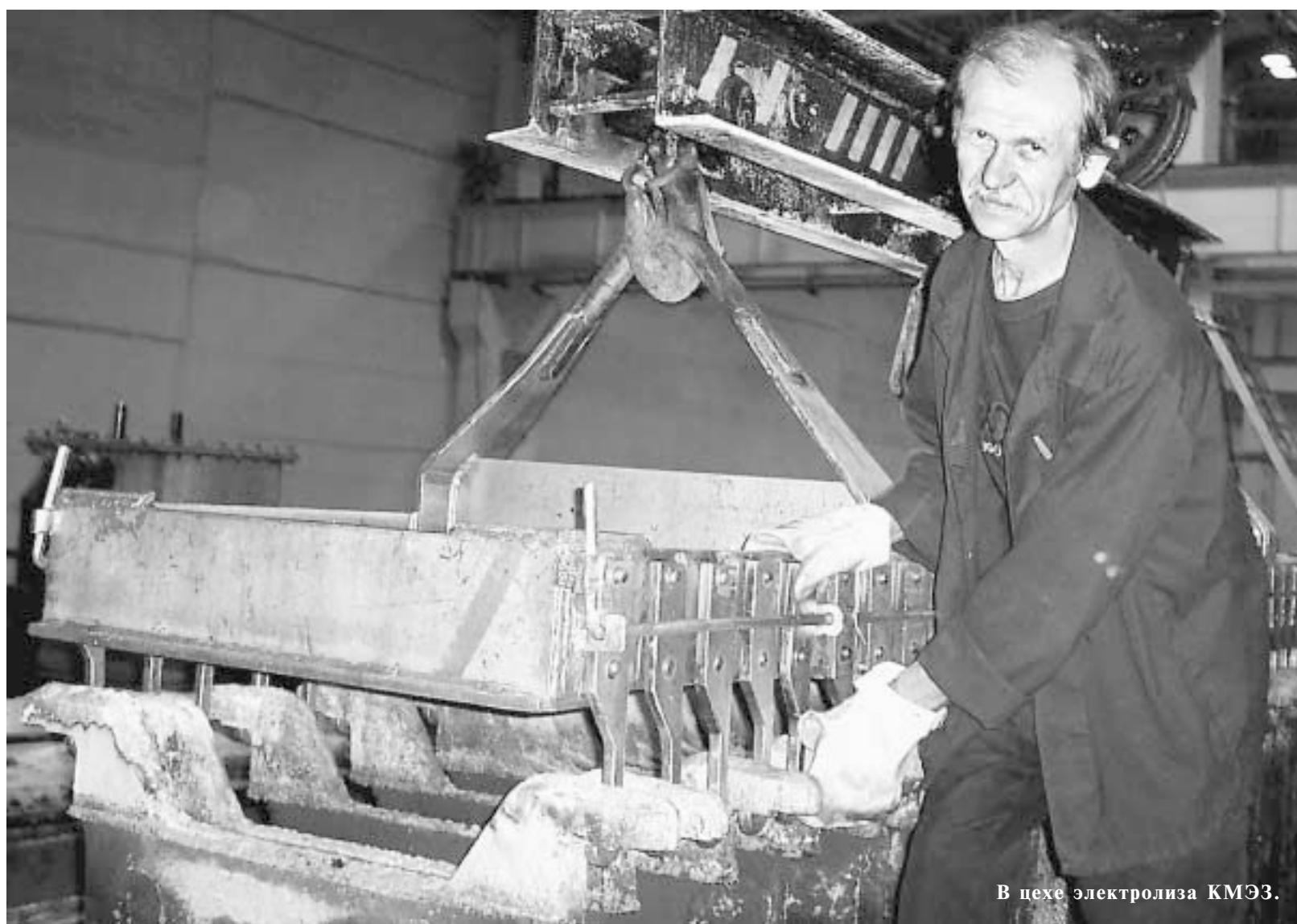
В цехе электролиза КМЭЗ.