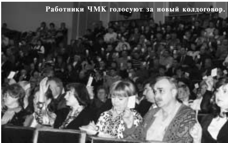
Работники ЧМК голосуют за новый колдоговор.