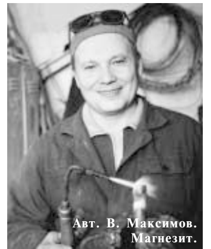
Авт. В. Максимов. Магnezит.