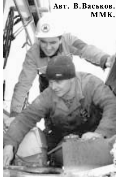
Авт. В. Васьков. ММК.